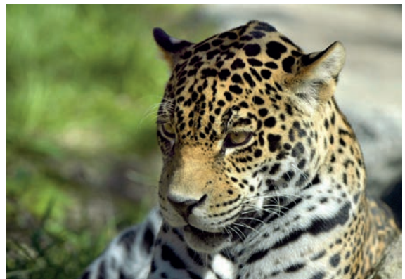
Julie Larsen Maher/WCS

Es conocido por su habilidad para trepar, nadar y realizar desplazamientos grandes con bastante frecuencia (Seymour 1989; Nowell & Jackson 1996; Emmons & Feer 1999; Wallace et al. 2003; Ayala et al. , en prensa, sometido).