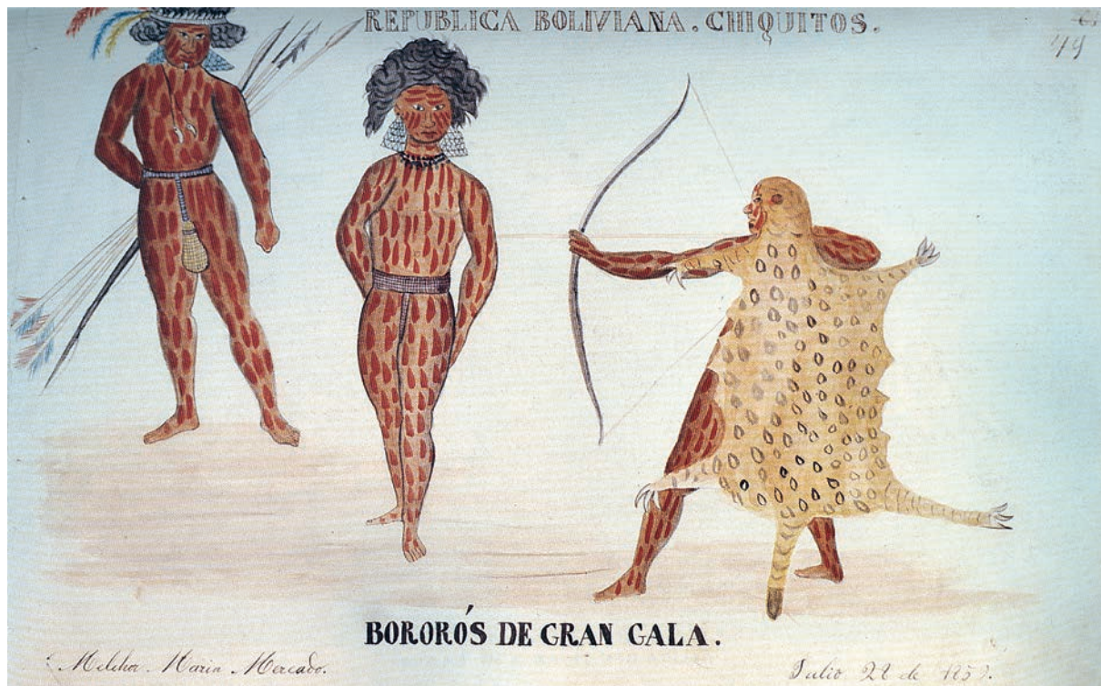
Bororos de Gran Gala, Chiquitos, Melchor María Mercado, 1841-1869

De igual modo, el jaguar, como algunos animales silvestres, se han convertido en una importante atracción para el desarrollo del turismo en áreas protegidas, y su imagen es utilizada como un símbolo de los esfuerzos de conservación. En el país, existen algunas iniciativas que promueven el turismo comunitario y resaltan el valor escénico del jaguar, tal es el caso de la "Ruta del Jaguar", una oferta turística que se realiza en el departamento de Santa Cruz y que se basa principalmente en caminatas por las sendas que hace este felino, para observar sus huellas y poder contemplarlo.